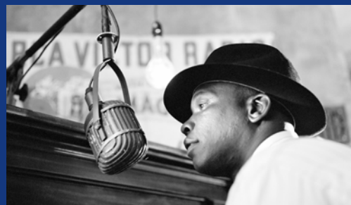
Szene aus „The Soul of a Man“ von Wim Wenders

DO 12 MÄRZ 19:00 Großer Saal Film und Musik BUENA VISTA SOCIAL CLUB Film und Konzert mit jungen kubanischen Musiker*innen Film: Buena Vista Social Club (D/USA 1998/99, R.: Wim Wenders, 105 Min.)