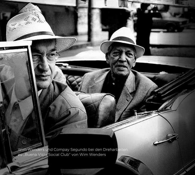
Wim Wenders und Compadre Segundo bei den Dreharbeiten zu „Buena Vista Social Club“ von Wim Wenders