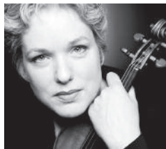
Isabelle van Keulen

Veranstalter: Hessischer Rundfunk in Zusammenarbeit mit dem Jugendamt der Stadt Frankfurt am Main und der Alten Oper Frankfurt Junge Konzerte Reihe A ■ € 14,50 (Endpreis) nur für Schüler, Studenten und Auszubildende gegen Vorlage eines Ausweises; Erwachsene nur in Begleitung eines Kindes/Jugendlichen Infos und Tickets beim Jugendamt der Stadt Frankfurt am Main, Tel. 069 212-38517 oder an der Abendkasse