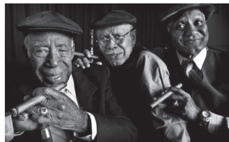
The Bar at Buena Vista

Die kubanischen Musiker präsentieren in karibischer Leichtigkeit das atmosphärische Havanna der 40er und 50er Jahre.